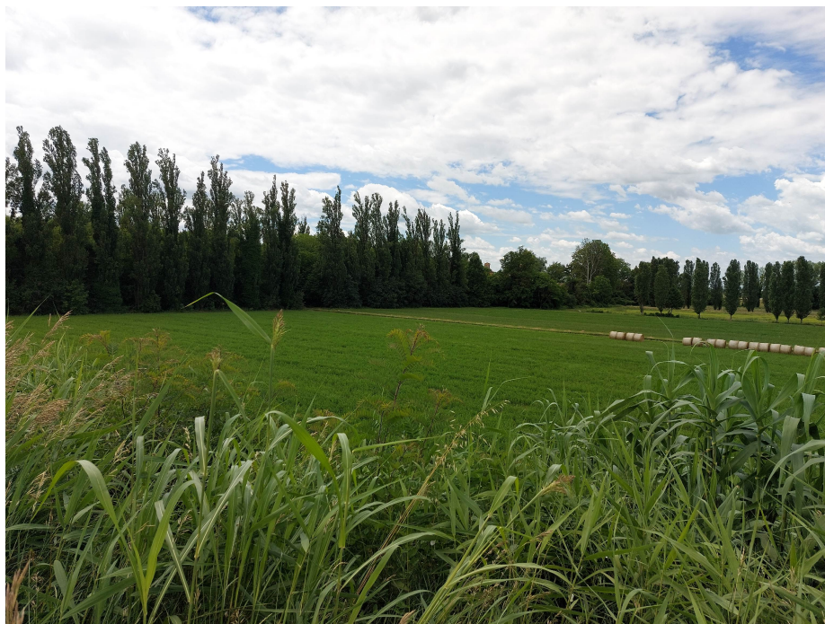
Il paesaggio circostante con la campagna a uso agricolo. Sullo sfondo il verde che circonda Villa Messerotti Benvenuti sul lato sinistro del fiume.