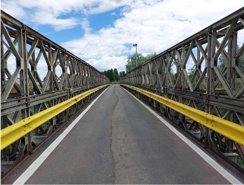
Il Ponte oggi. Vista interna