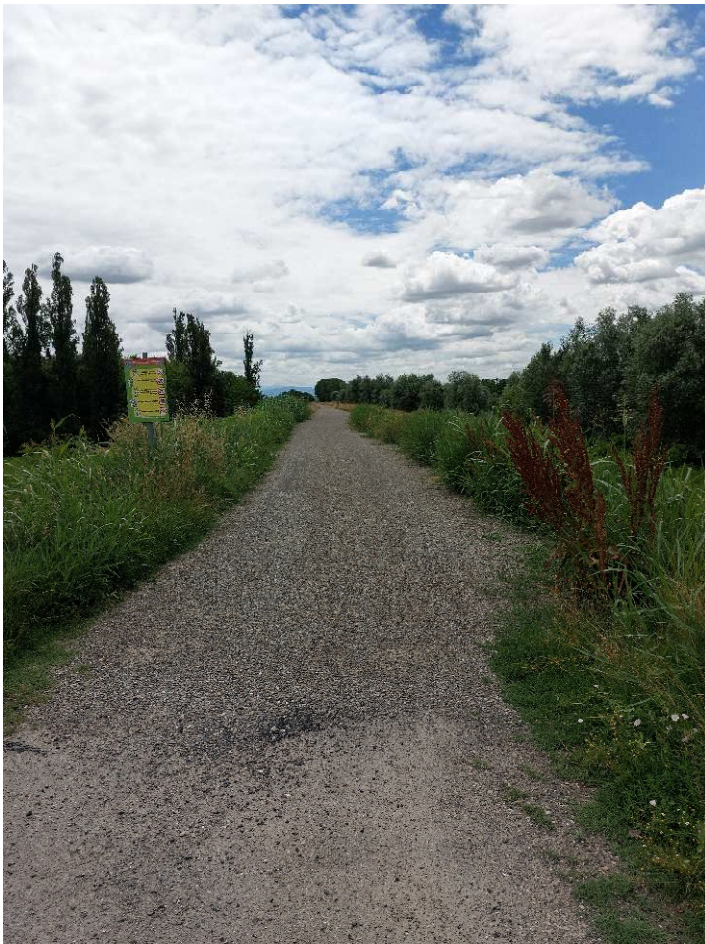
I percorsi ciclabili sugli argini rialzati.