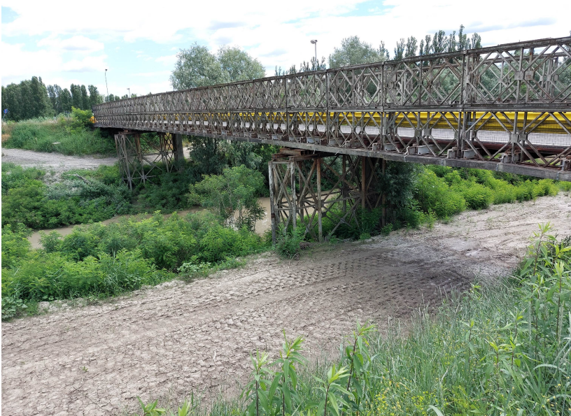
Il Ponte dell'uccellino oggi. Vista da sud verso lato, lato ovest.