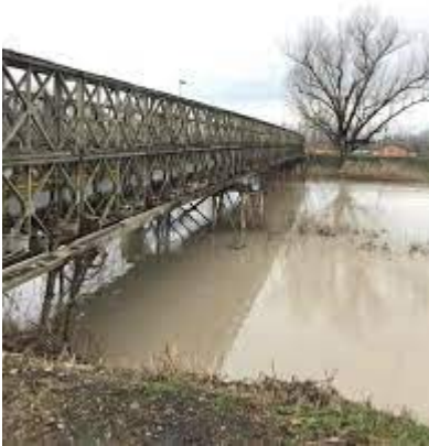
Il Ponte dell'uccellino realizzato nel 1985 con il sistema "Bailey" durante una piena del fiume Secchia.