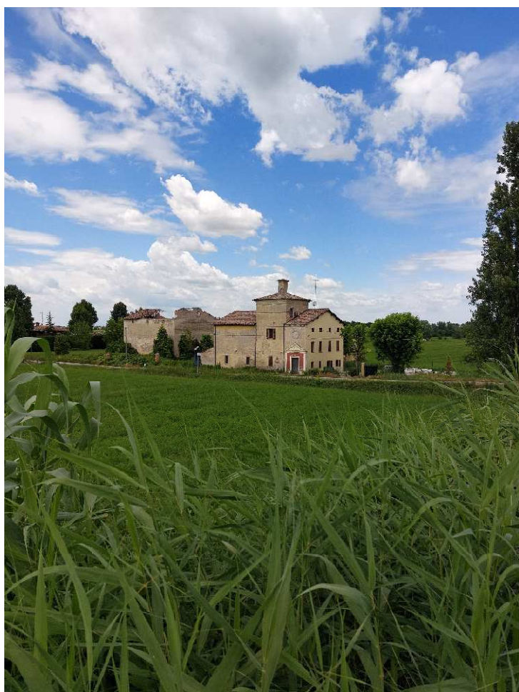
Il complesso Masserotti Benvenuti, già Codebò, lungo via Morello Confine.