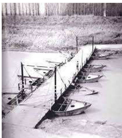
Il sistema di attraversamento a traghetto e il primo Ponte dell'uccellino di barche.